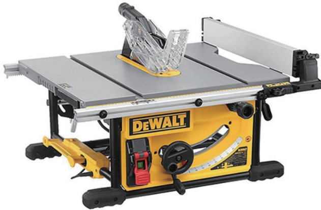
테이블쏘 디월트 DWE745(250mm)