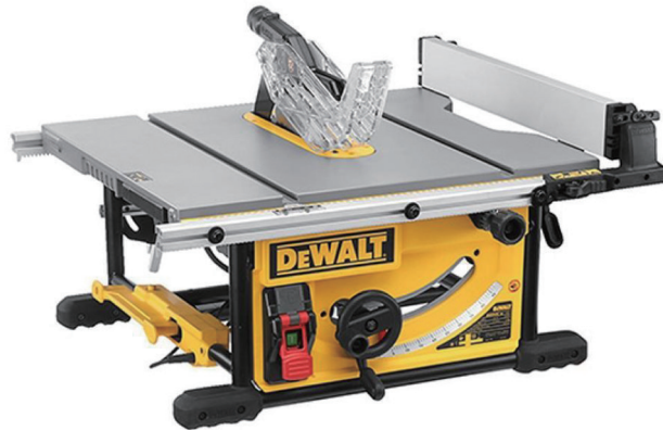
테이블쏘 디월트 DWE745